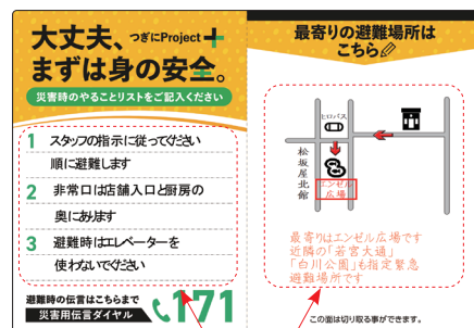
震災ステッカーの記入例