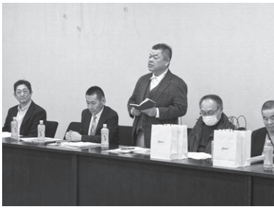
知多ブロック 3月3日(火) 武豊町商工会

ブロック長のご尽力のもと名古屋、西尾張、知多、東三河、西三河5地区のブロック協議会が開催されましたのでご報告いたします。それぞれの地域を担当する日本政策金融公庫の皆様と各ブロック所属支部の役員、幹部の方々が顔を合わせ、飲食業界が直面している問題や日頃疑問に思うことなど直接お話を伺える貴重な時間となりました。