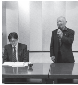
名古屋ブロック 11月18日(火) 札幌かに本家 栄中央店