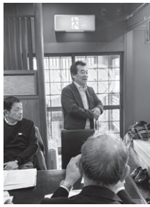
西尾張ブロック 2月17日(火) 八百菰