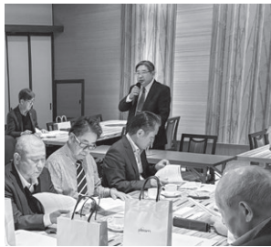
西三河ブロック 2月25日(水) 長春