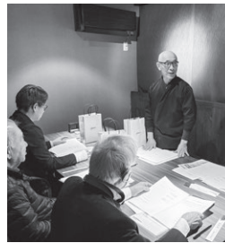
東三河ブロック 12月15日(月) 飛騨路