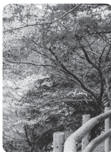
小原の四季桜と紅葉 (豊田市)