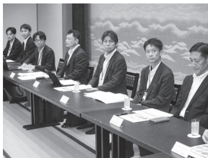
公庫6支店・指導センターの皆さま