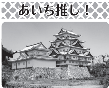
名古屋城 (名古屋市)