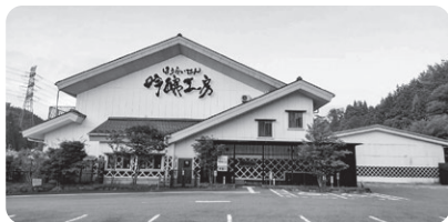
ほうらいせん吟醸工房 (豊田市)