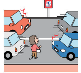
横断禁止場所横断